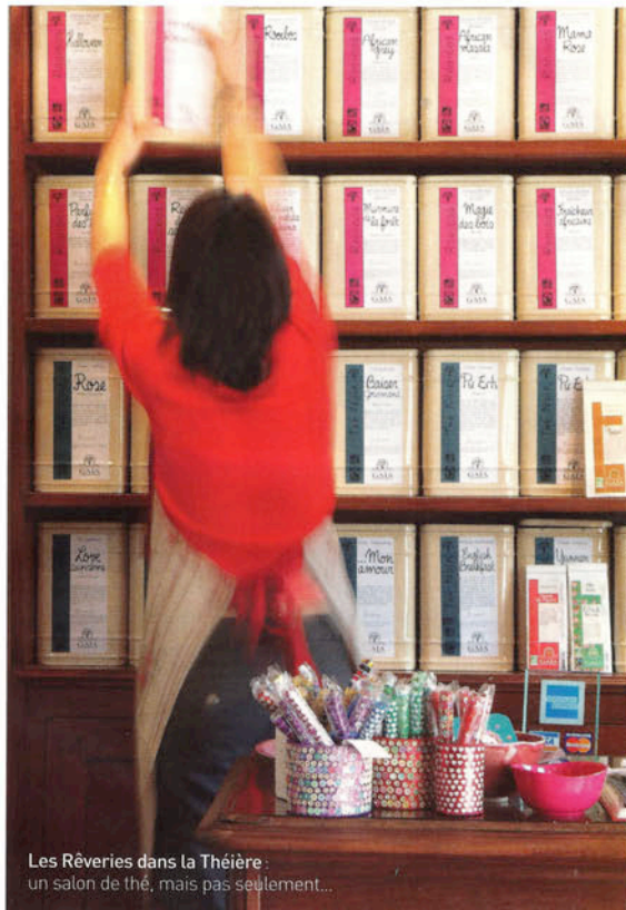
Les Réveries dans la Théière : un salon de thé, mais pas seulement...