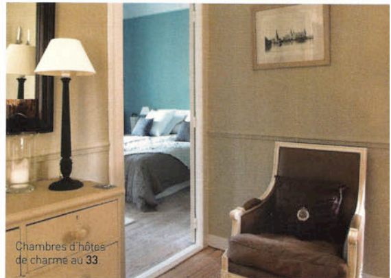
Chambres d'hôtes de charme au 33